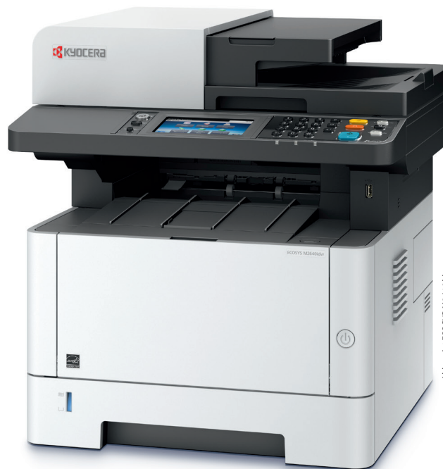
Abb. zeigt ECOSYS M2640idw.